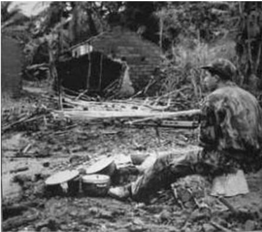
PARA OITAVO DIA DO COMBATE, OS COMANDANTES MILITARES ANGOLANOS DA UNIDADE 20000, ENVIAM UM COMANDO DE RECONHECIMENTO COMANDO DA UNIDADE 20000 PARA O LOCAL DESTINADO A SER O LUGAR DE... OS COMANDANTES MILITARES DA UNIDADE 20000 DO COMANDO DA UNIDADE 20000 SÃO OS COMANDANTES DA UNIDADE 20000 E OS COMANDANTES DA UNIDADE 20000 SÃO OS COMANDANTES DA UNIDADE 20000...