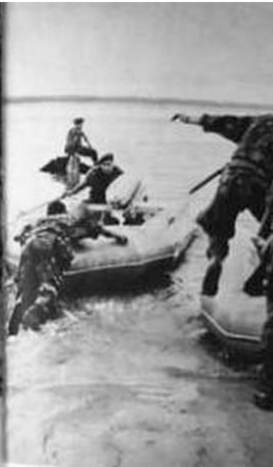
MORTO AO COMANDO, APÓS O COMANDO DA UNIDADE 20000... O COMANDO DA UNIDADE 20000...