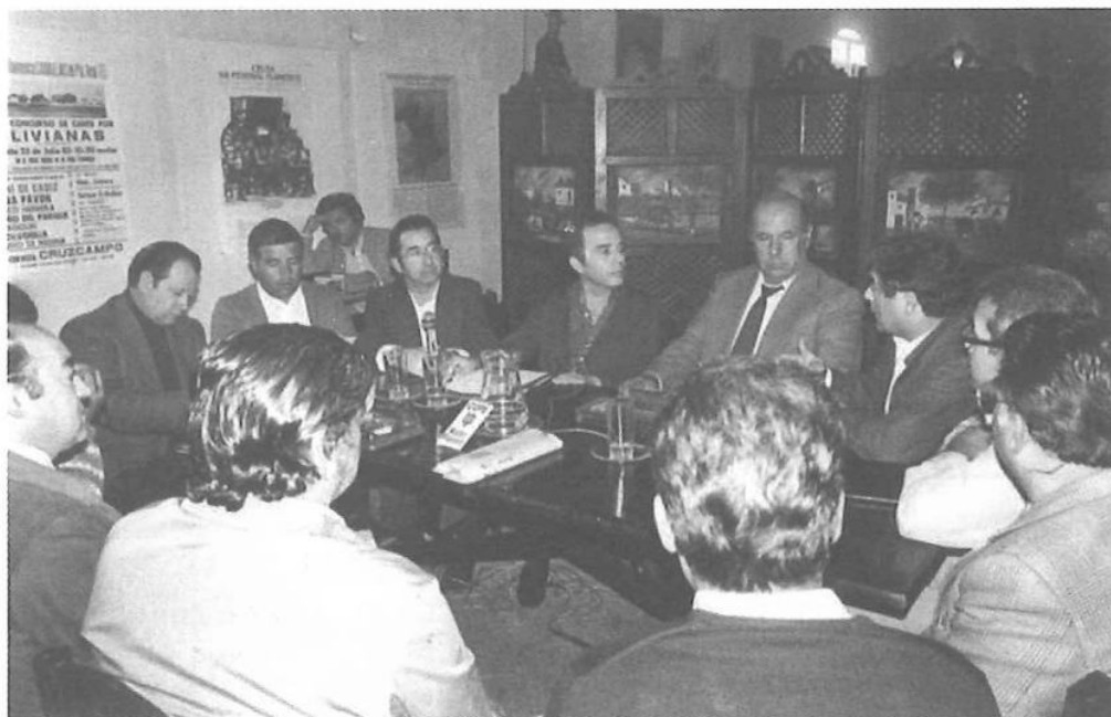
Una de las muchas mesas redondas del ciclo “Cátedra viva” estuvo dedicada a las peñas de la provincia de Cádiz, con participación de representantes de las más importantes.